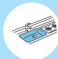
キッチンの水漏れ