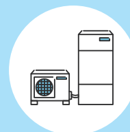
温水器やボイラーの取替